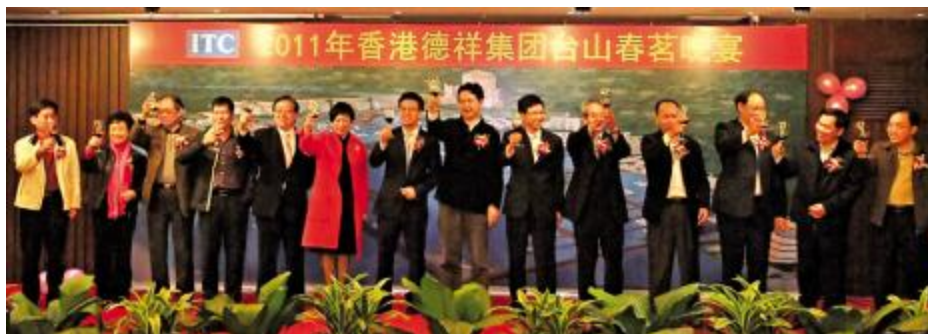
领导与嘉宾欢聚一堂举杯恭贺新春