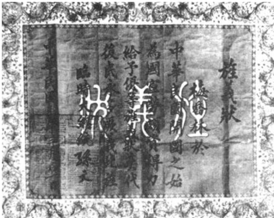
孙中山颁给梅乔林的旌义状

袁世凯窃国后，乔林回到新宁（台山）从事反袁斗争，主持新宁同盟会的工作；1913 年到香港，与李天德、陈耀平、陆国生等人组织“铁血团”，发动民众反对袁世凯窃国；1914 年，亲赴东京向孙中山报告“铁血团”的组织及活动情况，受到孙中山的赞扬。乔林在孙中山主持下，宣誓加入刚组建的中华革命党，继续为“实行民主、民生两主义”的宗旨及“扫除专制政治、建设完全民国”的目标而斗争。时袁世凯的爪牙龙济光盘据广州，乔林与朱执信等在澳门进行护国革命运动。1917 年，乔林随孙中山回广州，协助中华民国军政府进行反对段祺瑞卖国独裁统治的护法运动。1921 年，乔林随孙中山出师桂林，参