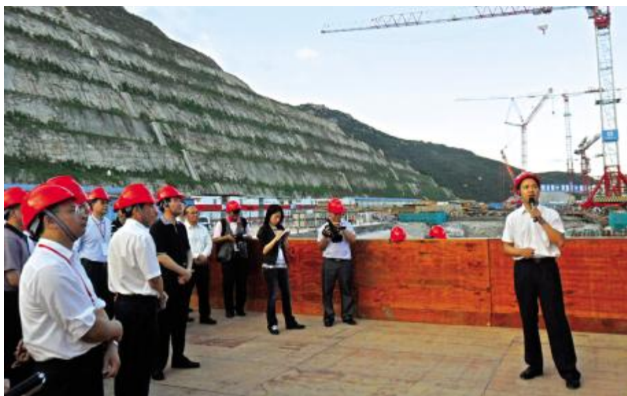
市委书记吴晓谋(右一)汇报我市招商引资等工作