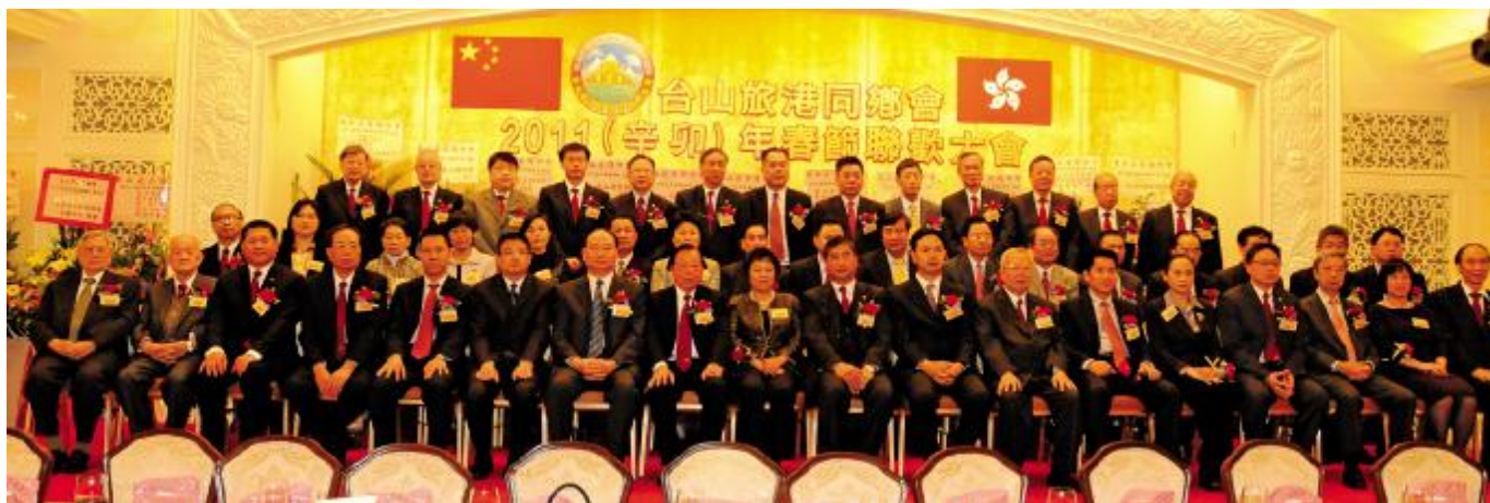
领导、嘉宾及台山旅港同乡会首长在主席台就座

4月9日,又是一个春和景明的好日子。台山旅港同乡会全体会员欢聚香港美心皇宫酒楼,共叙桑梓,同贺年禧。