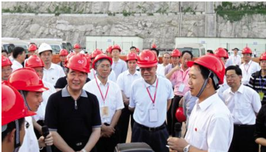
省委书记汪洋(前排左三)在台山核电项目工地考察

这次省委书记汪洋时隔一年后,又一次踏足台山这片沃土。汪洋一行先后考察了广东富华重工制造有限公司、台山核电项目等两项我市的重大项目。在广东富华重工制造有限公司里,汪洋一行深入到4号生产车间和公司的产品展示间仔细考察,并听取了公司负责人的介绍。富华重工是我市通过“双转移”引来的重点项目,预计总投资50亿元,项目投产后年产值将超过100亿元,主要为世界各地的半挂车制造业及运输业提供半挂车车轴等零部件。当听说公司积极实施产业转型升级,采用自己研发的核心技术,能够使无缝钢管一次挤压成型各类重型卡车的车桥,成为“世界车桥之家”后,汪洋很高兴,鼓励企业继续开拓进取,不断提升产业发展水平,加大自主创新力度,不断增强竞争力,把企业做