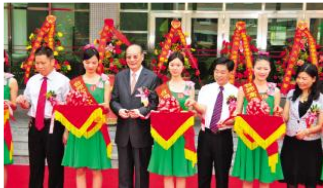
领导、嘉宾为台师高级中学学生生活中心剪彩