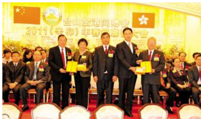
宾主双方互赠纪念品