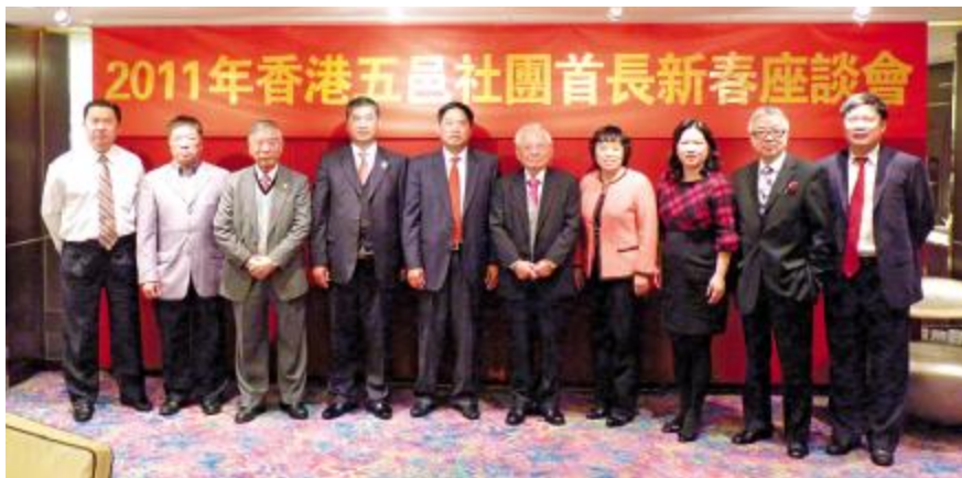
在社团首长座谈会上

江门市委副书记、市政协副主席谭继祖代表市委、市政府向出席座谈会的社团首长致以亲切的问候和节日祝福，感谢旅港乡亲一直以来对家乡的关心和大力支持，并向各位乡亲通报了“十一五”规划期间江门各项事业发展取得的成就。他说，在“十一五”规划期间，江门市委、市政府紧紧围绕《珠三角规划纲要》的要求，制定并实施一系列政策措施，带领全市人民努力拼搏，全市经济综合实力显著增强，各项主要经济指标实现了五年翻一番。目前，一批工业园区已初具规模，一批对产业链发展带动性强的龙头企业纷纷落户，一批上千亿元的产业集群有望形成，江门迎来了蓄势待发的机遇期。谭