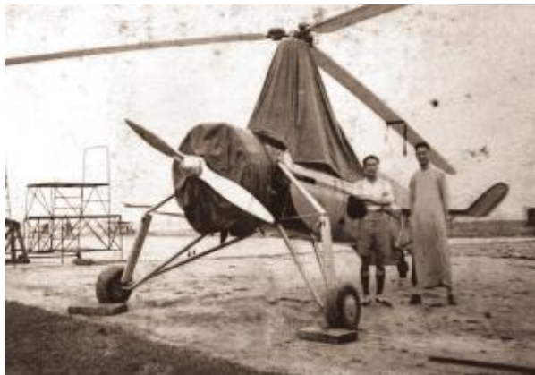
起义前“两航”人员在飞机前留影